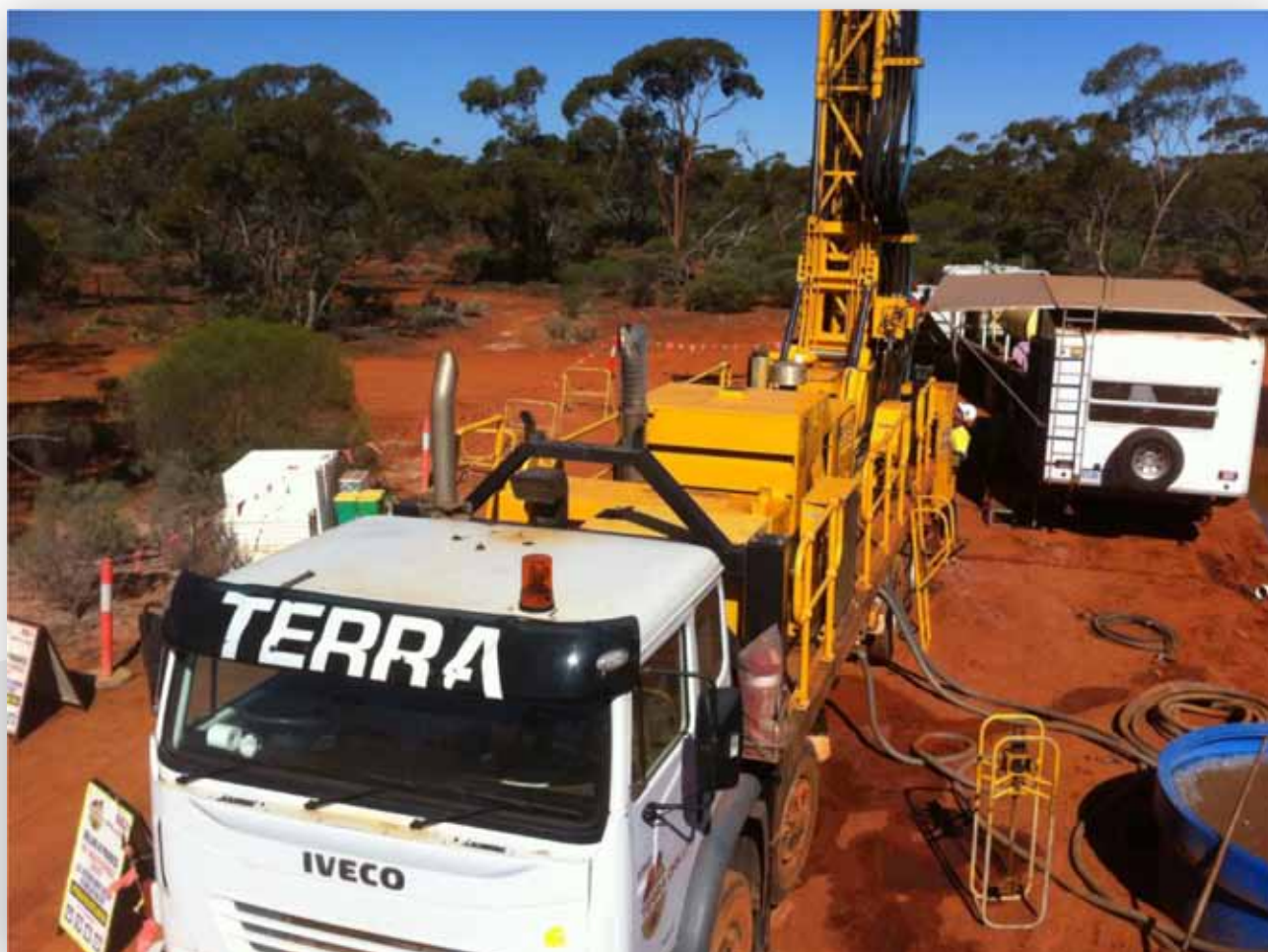
Slika 2 - Diamantno vrtanje na Mt Vettters

Kot je bilo objavljeno na Australian Securities Exchange ASX dne 8. Februarja 2013, je Proto začel postavitev diamantne vrtalne ploščadi k luknji PRC1 na Mt Vettters (glej sliko 2)