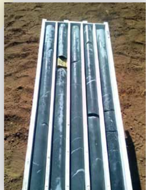
Slika 4 - Vzorci iz diamantne vrtine pri PRC1